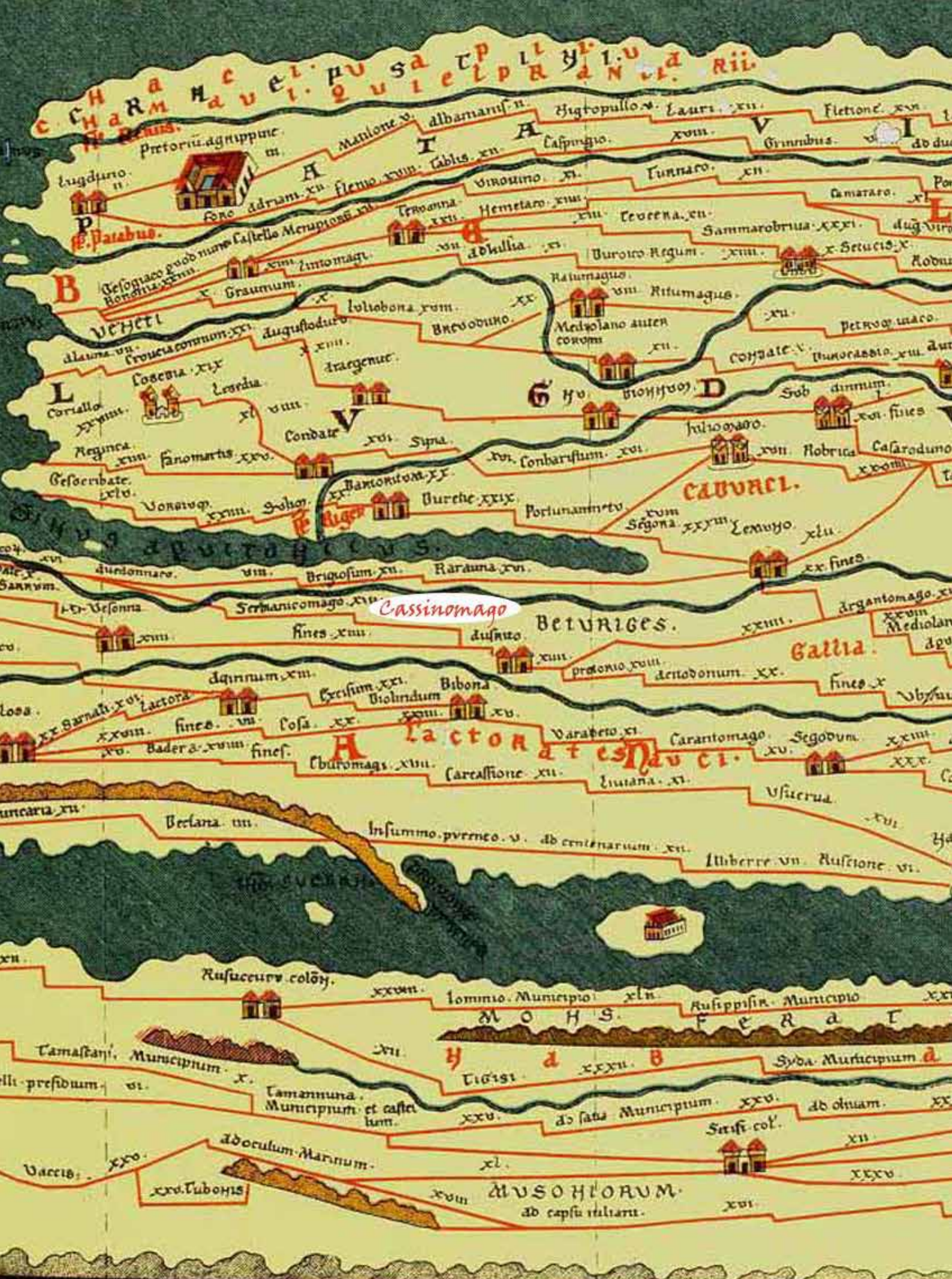
Table de Peutinger - Reproduction du XIII e siècle d'une carte routière du III e siècle